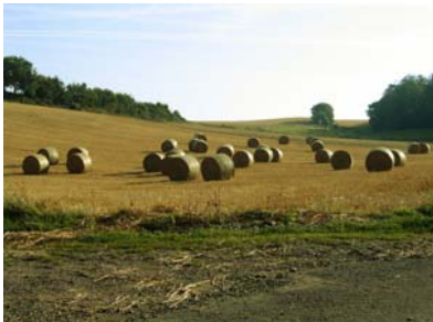
Szene aus der Umgebung