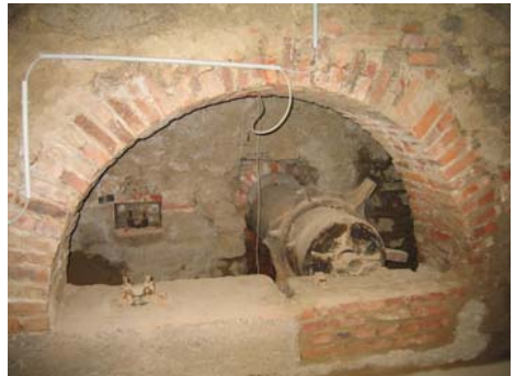
Achse des alten Mühlrades

Wir danken für die Finanzierung dieser Broschüre.